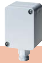
Fühler für Außenmontage Sensor for outdoor mounting